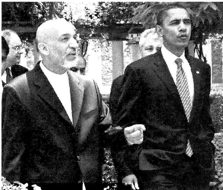
Il presidente afgano Karzai con quello americano Obama

In Afghanistan arrivano altri 15mila soldati e in agosto si apriranno le urne. La nuova strategia americana punta sulla mediazione, perché c'è talebano e talebano di Cecilia Tosi